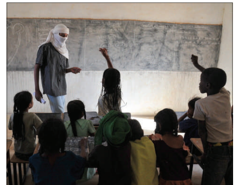
Un effectif maximum de 30 élèves est admis par classe pour assurer la qualité de l'enseignement.

Tous ceux qui souhaitent continuer à accompagner ce beau projet peuvent adresser un chèque à l'ordre de l'association TANAT.