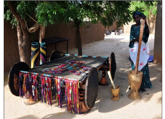
Lit, tendes: une partie du trousseau offert à la mariée.