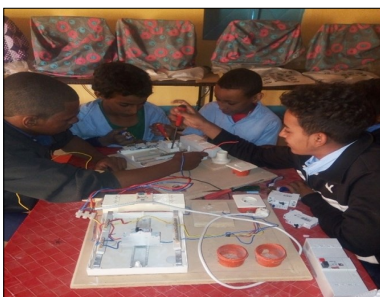
Cours d'électricité en 4eme

Toutes nos félicitations à nos deux brillantes élèves qui contribuent ainsi à la bonne réputation de l'établissement scolaire TANAT.