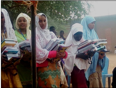
Remise des prix d'excellence à Tahoua